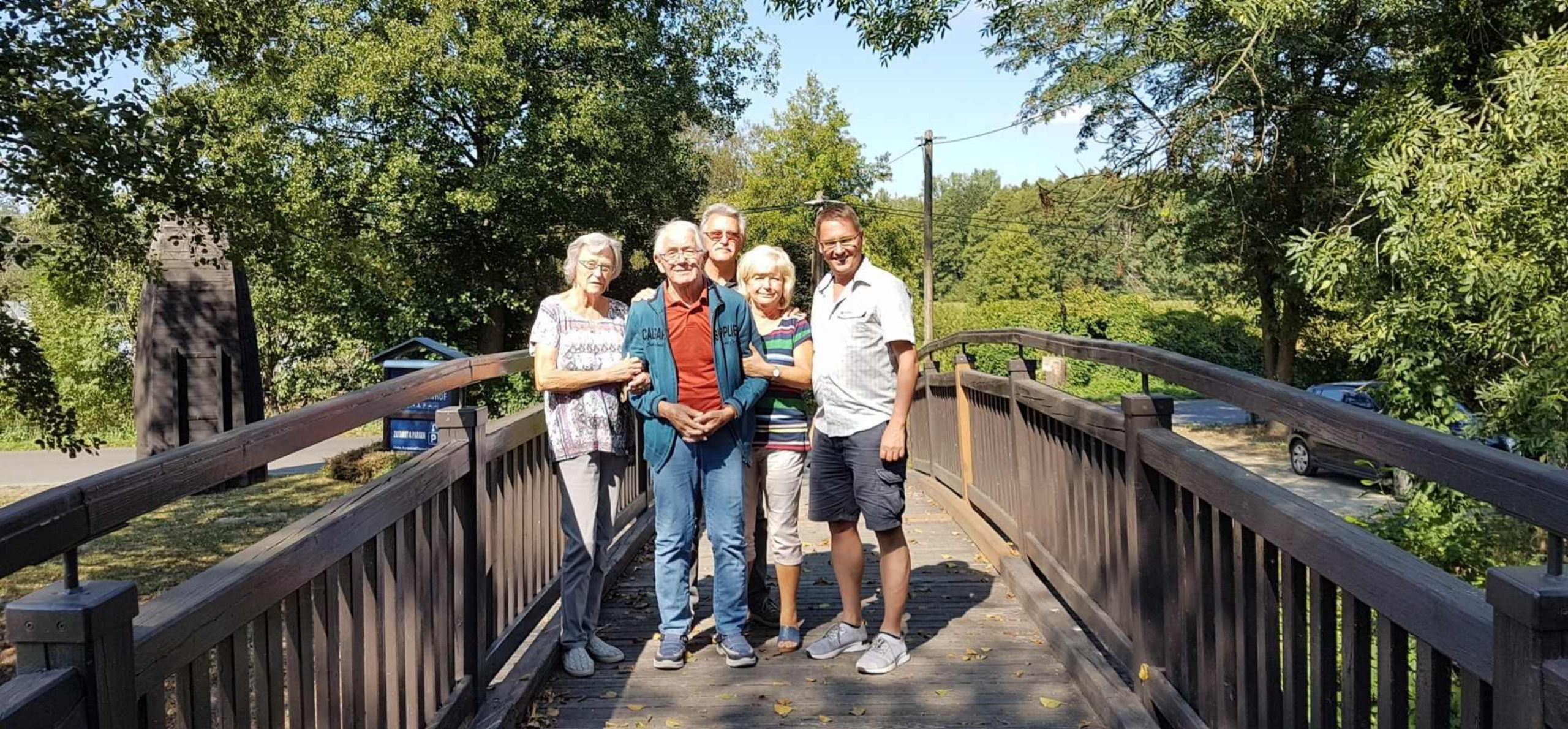
Reise der Alzheimer-Gesellschaft Brandenburg, Burg/ Spreewald 2018